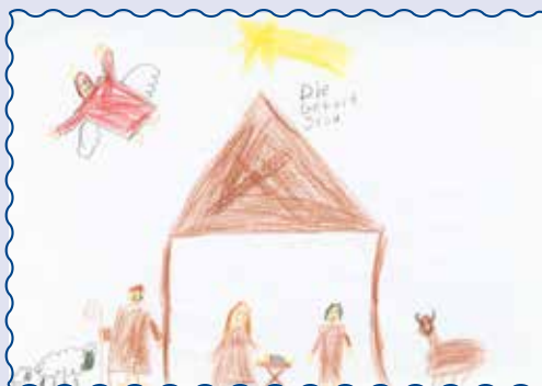
Сімон, 10 років