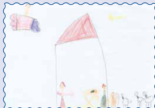
Софія, 6 років