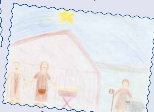
Йоганна, 12 років