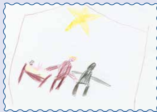
Кванг, 8 років