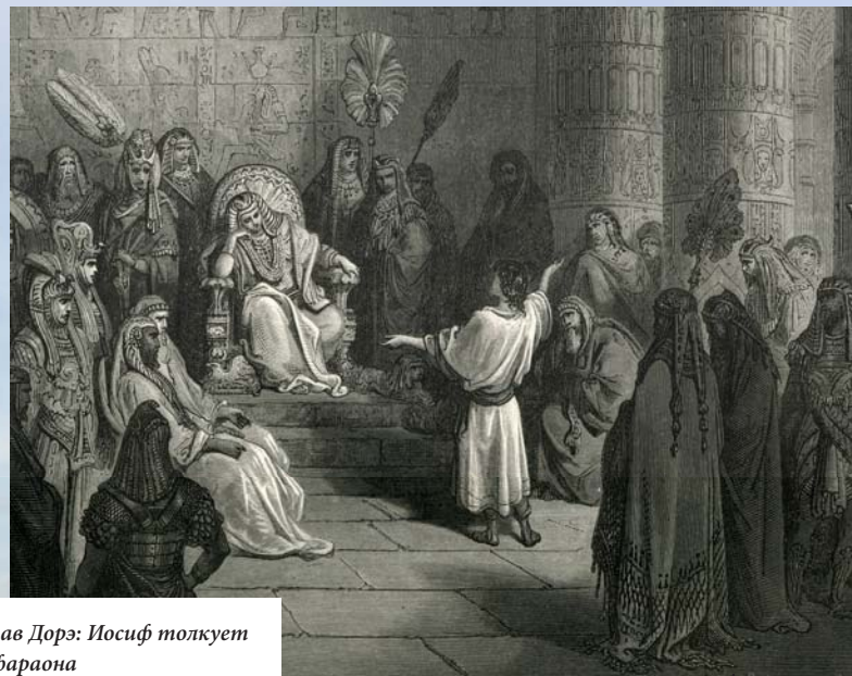
Густав Дорэ: Иосиф толкует сон фараона

От семьи Иакова в Египте произошел большой народ. Перед смертью Иосиф заставил своих братьев поклясться, что когда они вновь вернуться домой, они перевезут его останки в землю Ханаанскую и там похоронят. Иосиф умер в Египте в возрасте 110 лет.