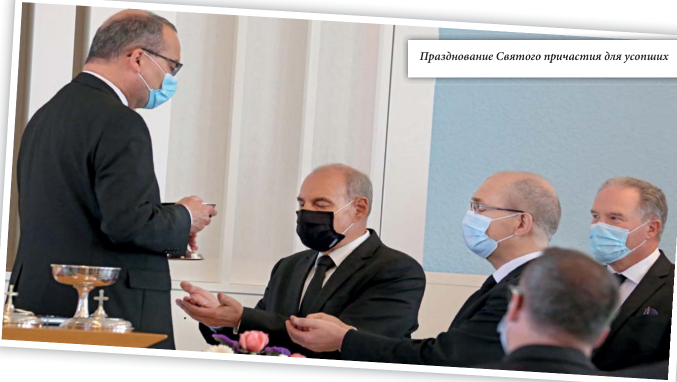
Празднование Святого причастия для усопших

там чаще всего и еда. Наша праздничная трапеза сегодня – это Святое Причастие. Вы знаете, что я француз, и мы, французы, любим праздновать победу в обоих мировых войнах. Сами французы, собственно, и не победили. Без помощи других они бы не победили; но мы празднуем. Что мы, собственно, празднуем? Мы празднуем то, что злые силы были сломлены, а свобода победила. В этом и заключается смысл этих двух праздников. Мы празднуем не свою собственную победу, этого мы не можем делать, а празднуем окончание войны. Мы празднуем мир. Это заставило меня задуматься. Сейчас мы не можем праздновать свою победу над злом. Мы ничего не сделали. Но то, что мы можем отпраздновать, – так это поражение дьявола и победу Иисуса Христа. Вот это радость! Иногда, когда ты страдаешь от того, что зло вытворяет на земле, хорошо снова представить себе: Господь Иисус победил всё это. Он самый сильный, Он одолел смерть и зло. Дни зла сочтены. Мы можем отпраздновать это сегодня со всей радостью.