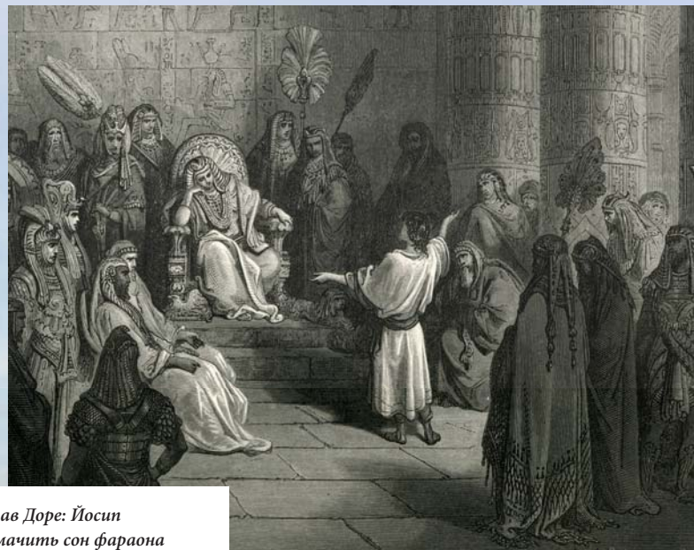
Густав Доре: Йосиф тлумачить сон фараона

З родини Якова в Єгипті походить великий народ. Перед смертю Йосиф змусив своїх братів заприсягтися, що коли вони повернуться додому, то перевезуть його останки до Ханаанського краю, де поховать його. Йосиф помер в Єгипті у віці 110 років.