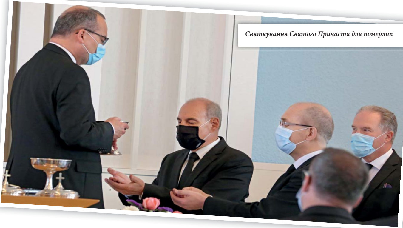
Святкування Святого Причасття для померлих

могли б самостійно; але ми все ж відзначаємо це свято. Що ми, власне, святкуємо? Ми святкуємо перемогу свободи над злими силами. У цьому полягає сенс цих двох свят. Ми святкуємо не свою перемогу, цього ми не можемо робити, а – закінчення війни. Ми святкуємо те, що прийшов мир. Це змушує мене замислитися. Ми не можемо святкувати власну перемогу над злом, бо самотужки нічого не зробили. Але ми можемо святкувати перемогу Ісуса Христа над дияволом. Ось що викликає у нас неабияку радість! Іноді, коли доводиться страждати від того, що зло коїть на землі, то добре збагнути: Господь Ісус переміг зло. Він найсильніший, він здолав смерть і зло. Дні зла полічені. Ми можемо з радістю сьогодні відзначати це свято.