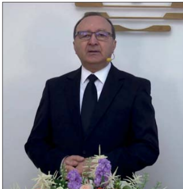
Львів Апостол Будник

християнська громада в Єрусалимі, очолювана Апостолом Петром. Апостол Петро виступив з палкою промовою після зішестя Святого Духа у присутності більше 3000 людей чоловічої статі, а також жінок і дітей, які чули й розуміли його проповідь кожен своєю мовою. Пристрасна проповідь Апостола викликала в присутніх непереможне бажання отримати хрещення.