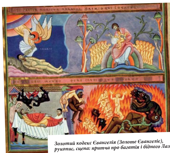
Золотий кодекс Євангелія (Золоте Євангеліє), рукопис, сцена: притча про багатія і бідного Лазаря

Уявлення про небо багато в чому відповідають уявленням книг Старого Заповіту. Ісус описує небо як ДІМ ОТЦЯ, в якому є чимало осель. Бог збудував і зберігає його у вічності.