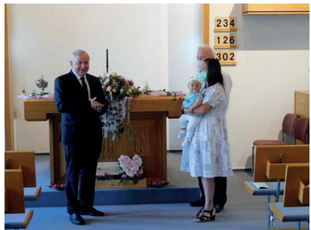
Під час святого хрещення Водю