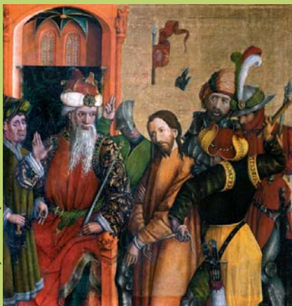
Фотос. Д-р Балмаллер