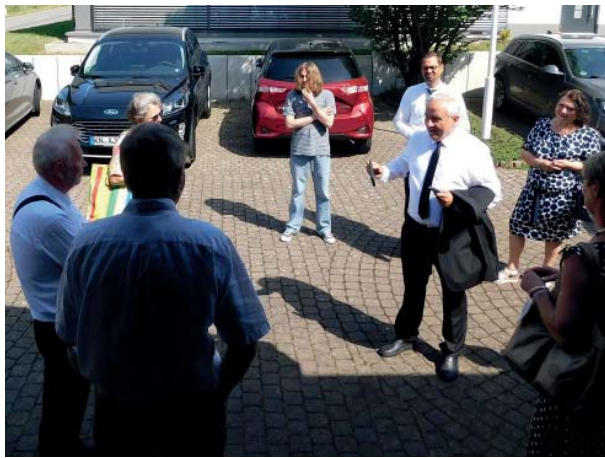
Спілкування на майдані перед церквою