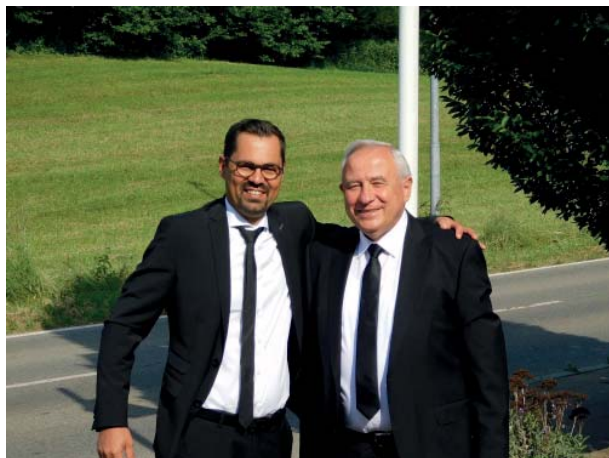
Настоятель округу Гюбнер та ОС Бих