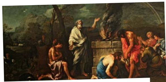
Францеско Ферранді (бл. 1720): Жертвник Ноя [полотно, олія]; Національний фонд, Стоурхед/Великобританія

У християнстві стіл, на який ставлять хліб і вино для ПРИЧАСТЯ , є також вівтарем. Апостол Павло назвав його «стіл Господній» (1-е Коринтян 10, 21). Сьогодні вівтарі знаходяться у всіх християнських церквах.