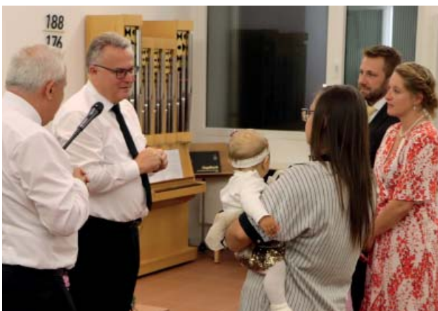
Промова Апостола Шнауфера перед святим Запечатанням