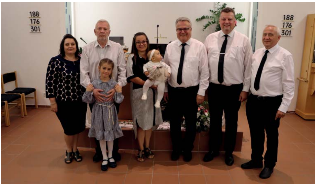
Спільне фото з Апостолом Шнауфером біля вітара

яка любить свого ближнього, бажає працювати над своїм освяченням». «Бог хоче, - продовжив Апостол, - аби «уся наша істота - дух і душа, і тіло - були збережені без плями на прихід Господа нашого Ісуса Христа». Під час земного життя наша душа з допомогою тіла й духа здобуває духовну поживу, вона, зокрема, слухає Боже слово й приймає Святе Причастя. З допомогою тіла ми впроваджуємо Боже слово у життя і сприяємо своєму освяченню. Якщо ми проявлятимемо любов до Бога й до свого ближнього, то Бог збереже нашу душу «без плямина прихід Господа нашого Ісуса Христа», - завершив проповідь Апостол.