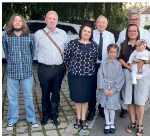
Спільне фото з Апостолом Шнауфером перед початком богослужіння

У громаді панувала піднесена й святкова атмосфера. Після богослужіння присутні брати й сестри потисканням рук вітали батьків хрещеників. Усі мали прекрасну нагоду особисто поспілкуватися з Апостолом, розповісти йому про те, що в них на серці. Брати й сестри ще довго згадуватимуть про цю радісну зустріч з Апостолом й з нетерпінням чекатимуть на нову зустріч з ним.