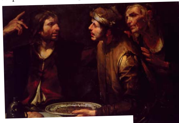
Джоаккіно Ассерето: Ісав продає своє право первородства (близько 1645)

ДРУЖИНА ПОКІЙНОГО в Біблії взагалі не розглядалася як спадкоємиця. Після смерті чоловіка про неї дбали її діти. Якщо вона не мала дітей, то або поверталася в сім'ю свого батька, або виходила заміж за одного з братів покійного. Тоді це називалося шлюбом із ДЕВЕРОМ (ЛЕВІРАТНИЙ ШЛЮБ) . Перший син від цього шлюбу вважався сином покійного брата. Він ставав його нащадком і таким чином зберігалося ім'я покійного. Метою левіратного шлюбу був захист дружини й збереження сім'ї померлого.