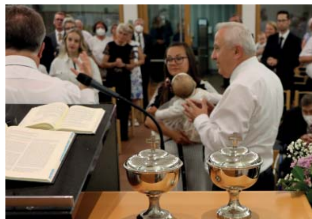
Переклад ОС Биха під час святого Запечатання