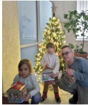
Одеса, подарунки дітям