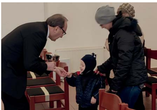
Николаев. Во время Святого Причастия

В праздничные дни Вербного воскресенья, 1-2 апреля 2023 года, Апостол Будник впервые после начала войны провел богослужения в Николаеве и Одессе, ведь опасность обстрелов в этих городах была очень высокой. В связи с военными действиями воздушное пространство над Украиной закрыли, поэтому Апостолу пришлось проехать на автомобиле почти 2 тысячи километров. В обеих общинах Апостол служил библейским словом на Вербное воскресенье: «Не бойся, дочь Сионова! се Царь твой грядет, сидя на молодом осле. Ученики Его сперва не поняли этого; но когда прославился Иисус, тогда вспомнили, что так было о Нем написано, и это сделали Ему» (От Иоанна 12, 15–16).