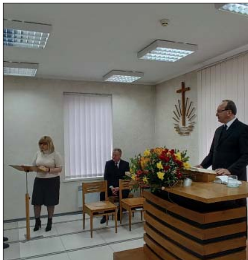
Одесса. Во время чтения из Библии