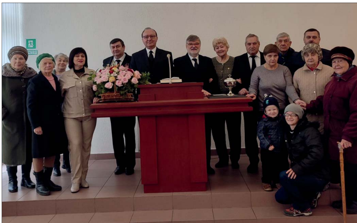
Николаев. Групповое фото

Практически все прихожане, которые остались в городе, пришли на богослужение. Словами невозможно передать чувства, которые наполняли сердца и прихожан, и Апостола. После богослужения, во время чаепития, делились радостными воспоминаниями о довоенных днях; прихожане, особенно в Николаеве, рассказывали об ужасном времени, когда город подвергался страшным обстрелам и как Бог хранил и оберегал их. И у всех в сердцах была благодарность Богу за то, что он не покинул их в это страшное время.