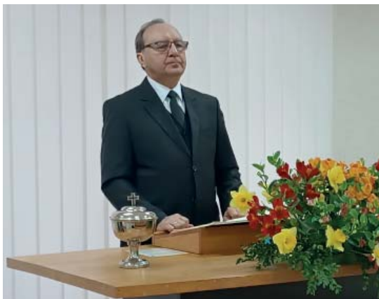
Апостол Будник за алтарём