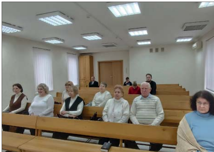
Одесса. Во время богослужения