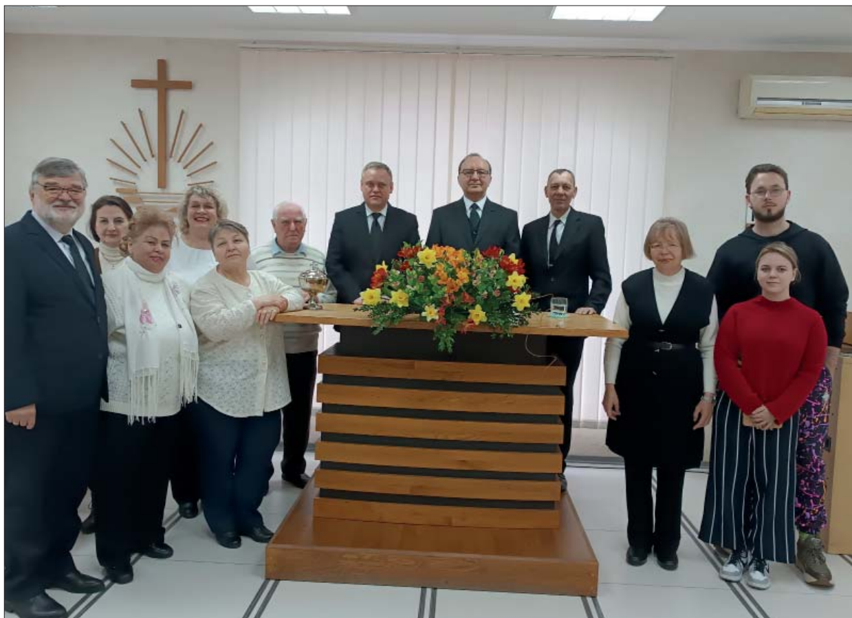
Одесса. Групповое фото