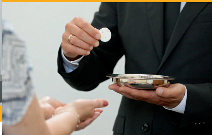
и верующим передаются просвиры

Вера в прощение грехов является основным элементом христианской веры. Оно прямо упоминается уже в древних церковных Символах веры и в третьем положении Новоапостольского Символа веры. Тем самым выражается, что возможность прощения грехов возникла благодаря жертве Христовой. Христос отдал Свою жизнь, чтобы люди освободились от грехов. Освобождение от господства греха происходит в ходе Святого крещения водою, в котором смывается первородный грех. Однако ни водное крещение, ни прощение грехов на богослужении не освобождают человека от склонности к греху (конкупищенция). Человек грешит постоянно.