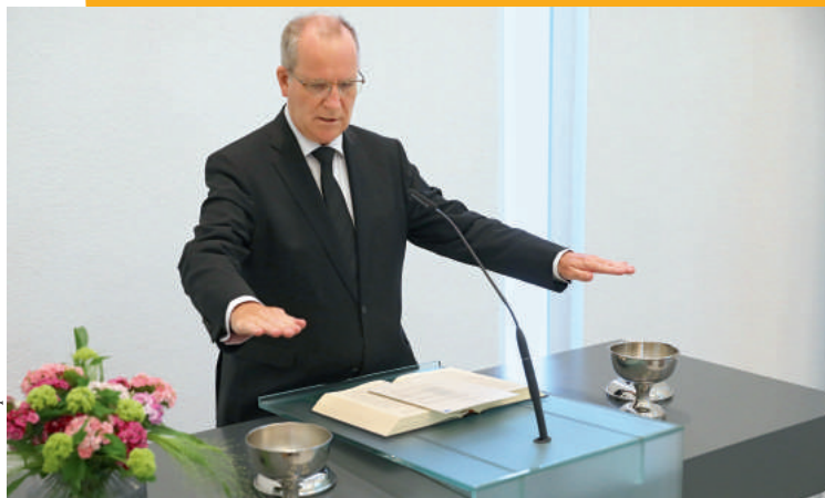
«При освящении чаши для причастия открываются