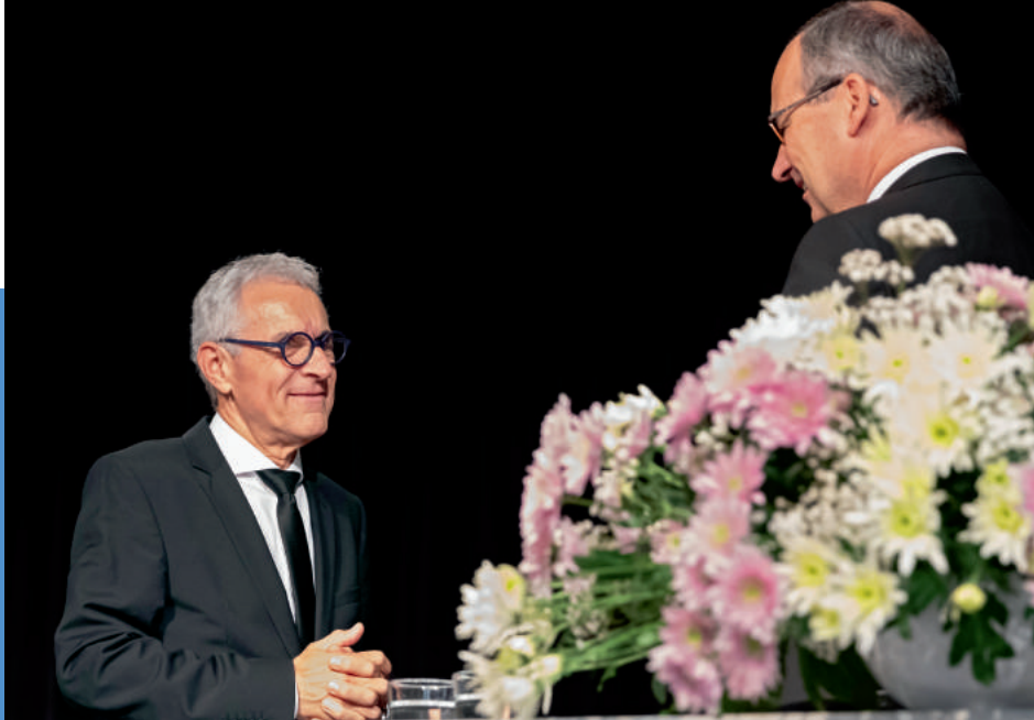
« Первоапостол переводит Апостола Вольфганга Шуга на покой