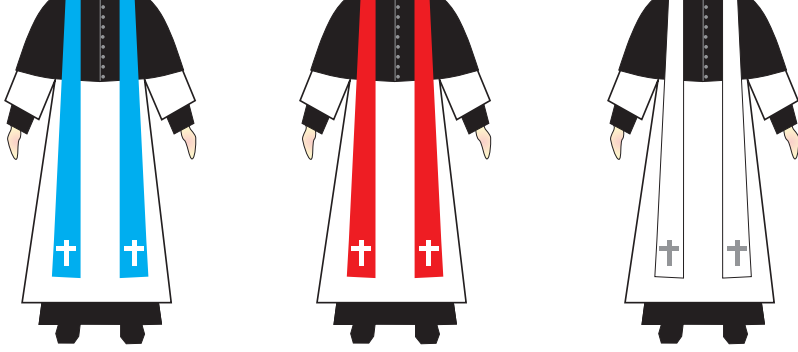
« Разноцветные накидки поверх белой туники символизируют различные саны в Католико-апостольской церкви

и за умерших. Данный этап завершался заключительной молитвой перед дарованием Святого причастия (причащение), в которой молились о скором Втором пришествии Христа. Затем руководитель богослужения приглашал общину к Святому причастию, за которым следовало песнопение «Агнус Деи» («Агнец Божий»), возглас: «Святая святым», приветствие мира и благословение. Причащение завершалось пением, за которым следовала молитва. Богослужение заканчивалось через два-три часа хвалебным пением гимна «Te Deum» («Тебя, Бога, хвалим») и заключительным благословением.