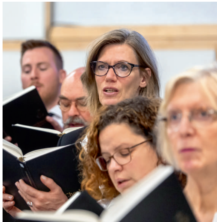
⌘ Органистка сопровождает игрой пение общины