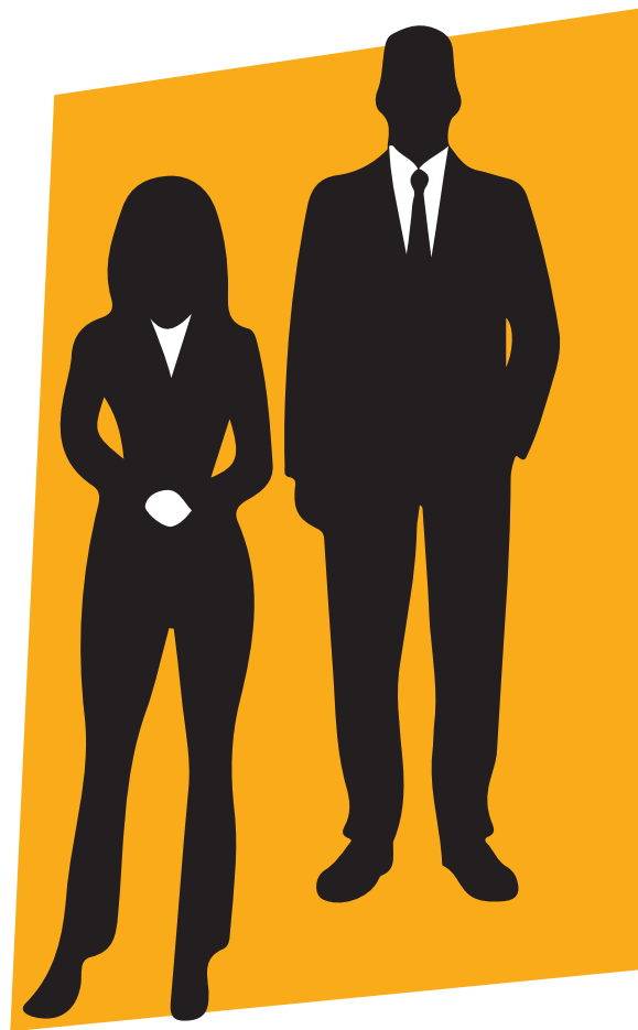
⌘ Сьогодні священнослужителі й священнослужительки носять чорний костюм

Літургійна реформа 2010 року, зрештою, переслідувала мету відновити деякі корені апостольського богослужіння. Отже, сьогоднішнє новоапостольське богослужіння складається знову з двох основних ча-