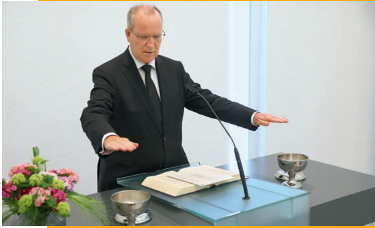
«Перед освяченням чаші для причастя відкриваються»