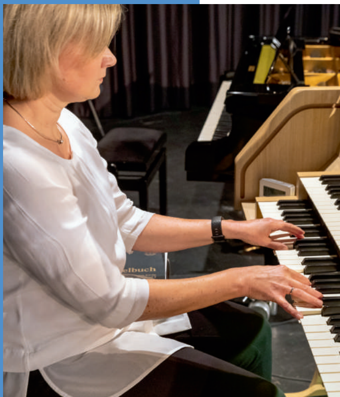
⌘ Органістка акомпонує співу громади