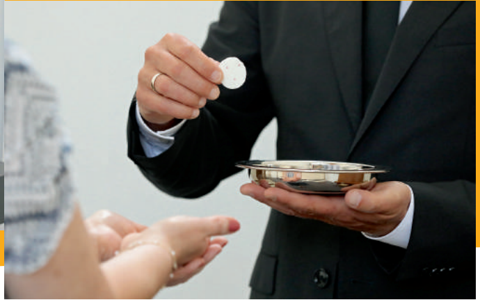
≈ і віруючим подають гостії

щенню водою, під час якого змивається первородний гріх. Однак ні водне хрещення, ні відпущення гріхів під час богослужіння не звільняє людину від схильності до гріха (лат. конкупісценція – пристрасть). Людина постійно грішить.