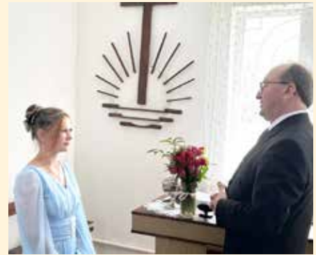
Новоолександрівка. Під час Конфірмації