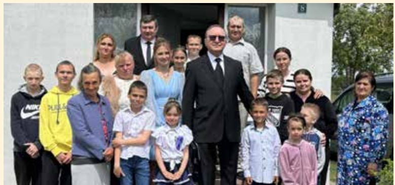
Новоолександрівка. Спільне фото з Апостолом