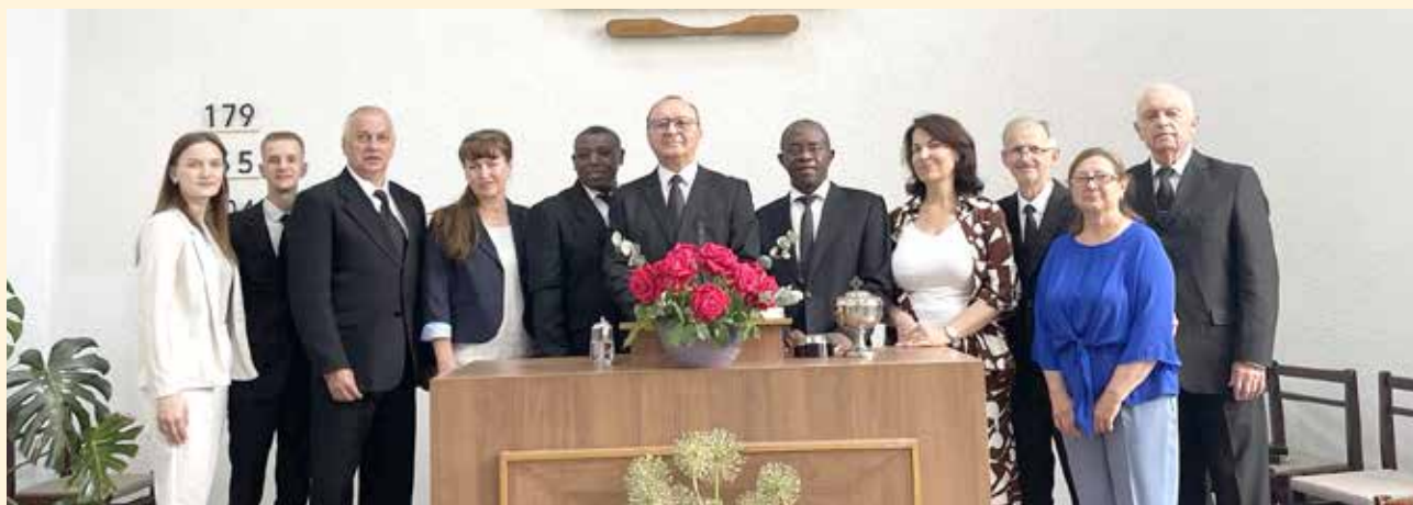
Полтава. Спільне фото з Апостолом

У неділю, 15 червня 2025 року, проходило недільне богослужіння Апостола для усієї громади, в основу якого була покладена біблійна цитата з Євангелії від Івана 11, 25-26: «А Ісус їй: «Я – воскресіння і життя. Хто в Мене вірує, той навіть і вмерши – житиме! Кожен, хто живе і в Мене вірує, – не вмере повіки. Віриш тому?» Апостол наголосив на важливості воскресіння Ісуса Христа, яке є запорукою нашого воскресіння під час Його Другого Пришестя. На богослужіння панувала прекрасна атмосфера, а після богослужіння довго не розходилися, радісно спілкувалися один з одним.