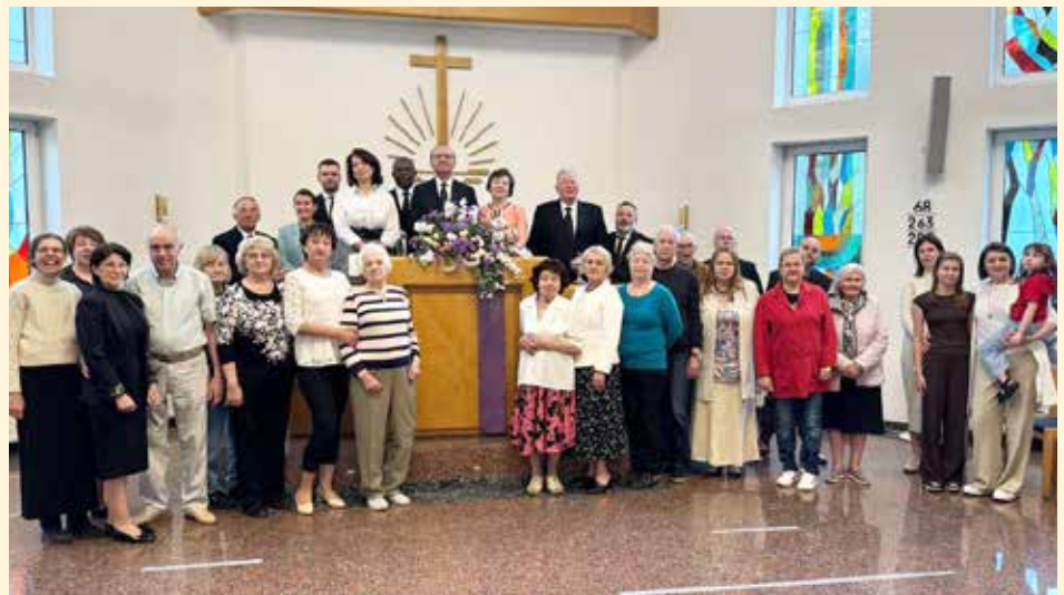
Київ. Фото після недільного богослужіння