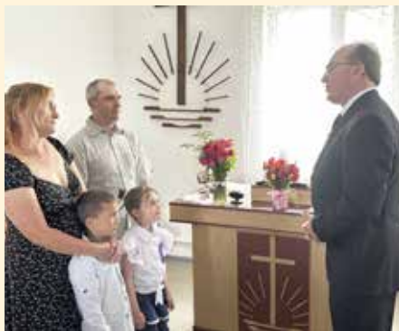
Новоолександрівка. Під час Святого Запечатання