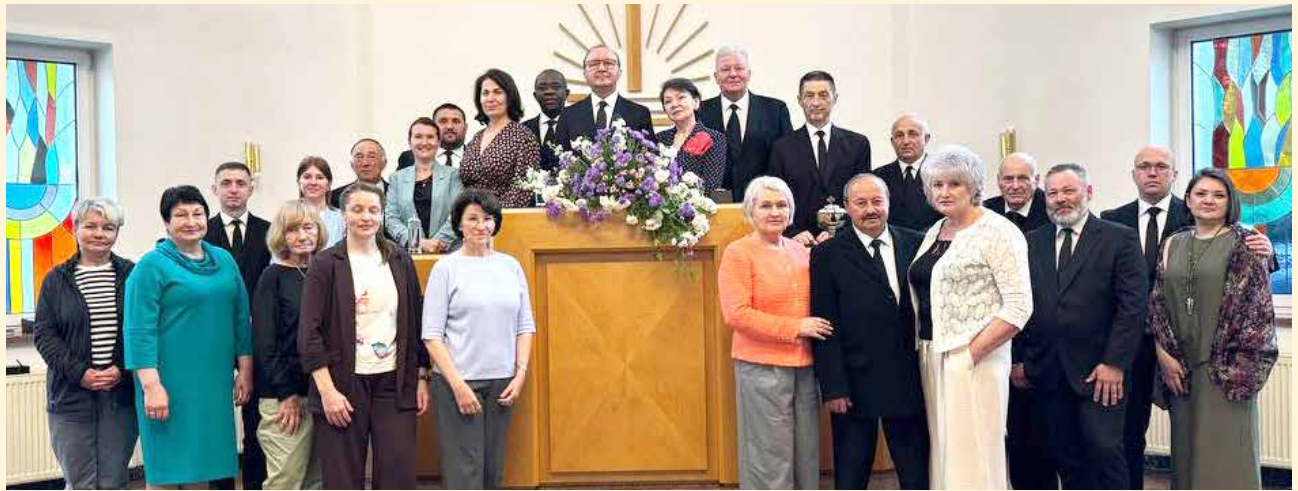
Київ. Спільне фото з Апостолом