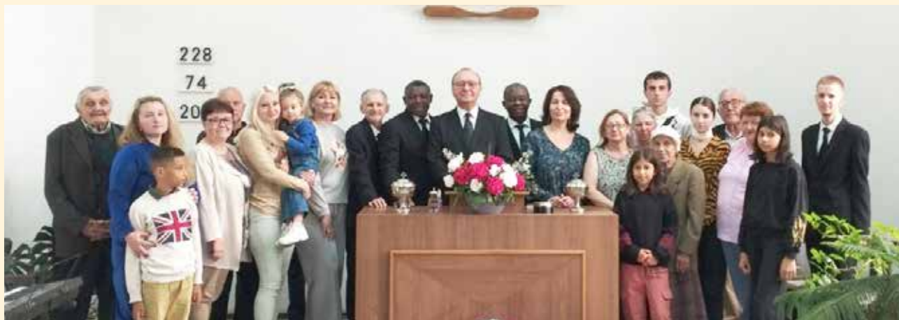
Полтава. Фото після недільного богослужіння