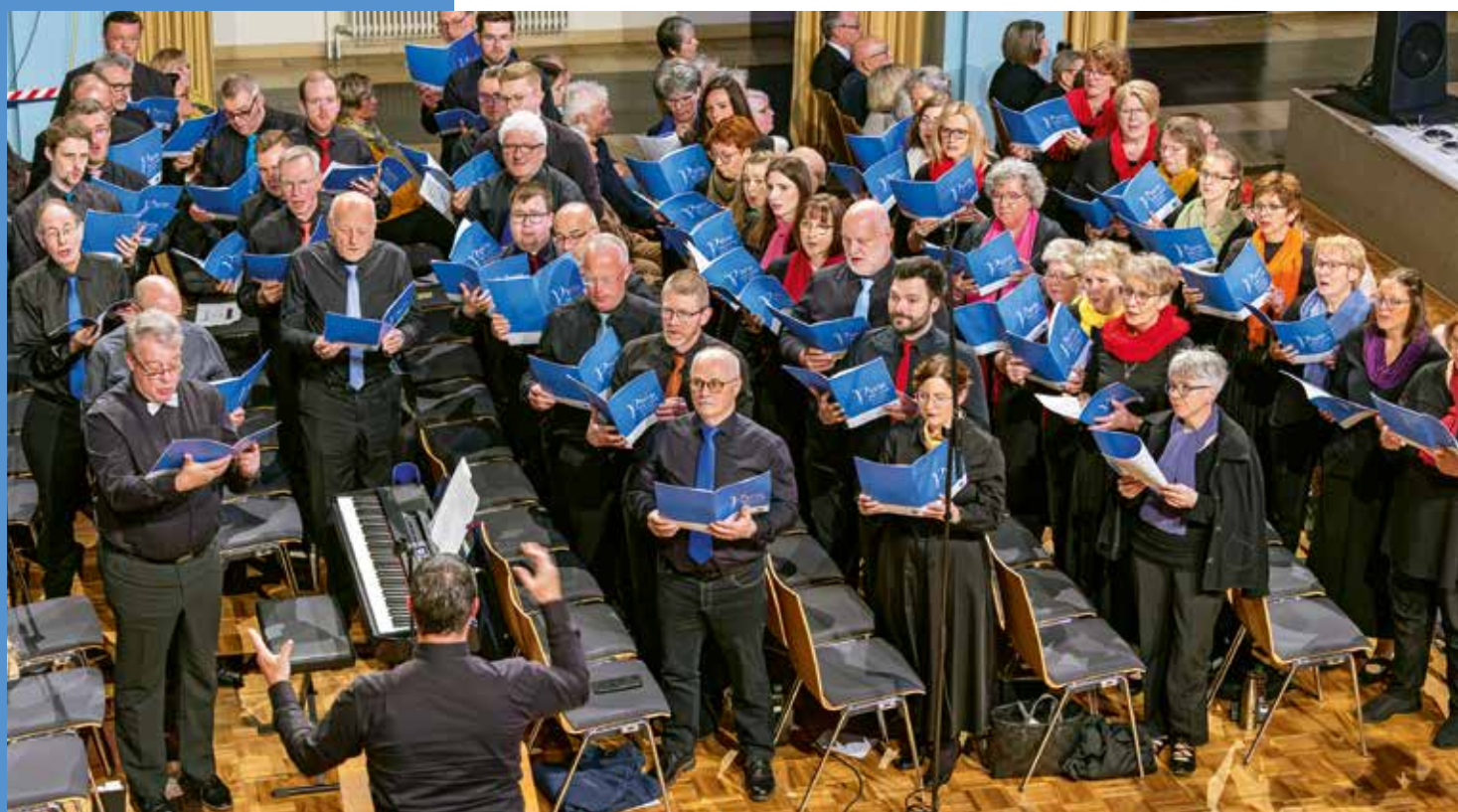
⇒ Хор обрамлював богослужіння виконанням пісень