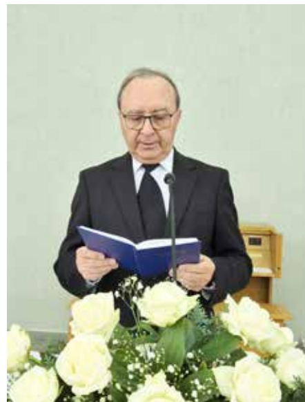
Тернополь. Апостол за алтарем

После богослужения состоялось живое общение с Апостолом и присутствующими прихожанами и гостями.