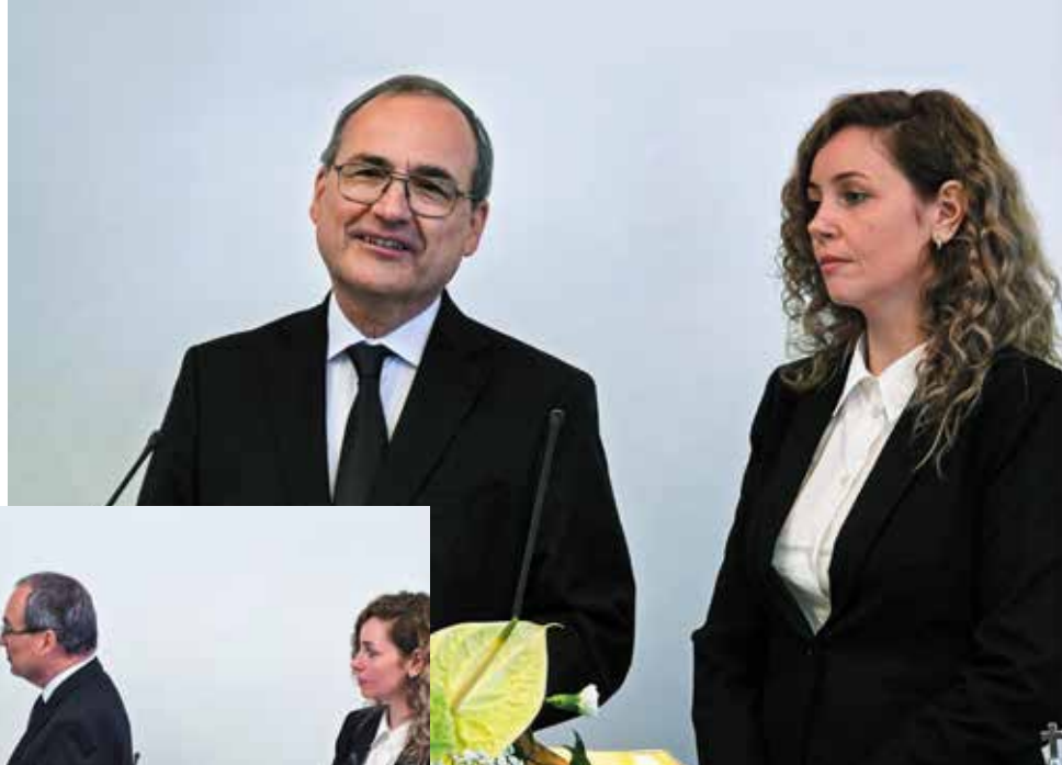
Первоапостол » и переводчица