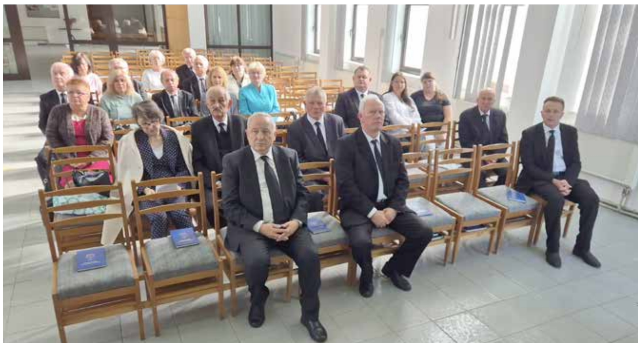
Тернополь. Во время богослужения Апостола для служителей и супругов