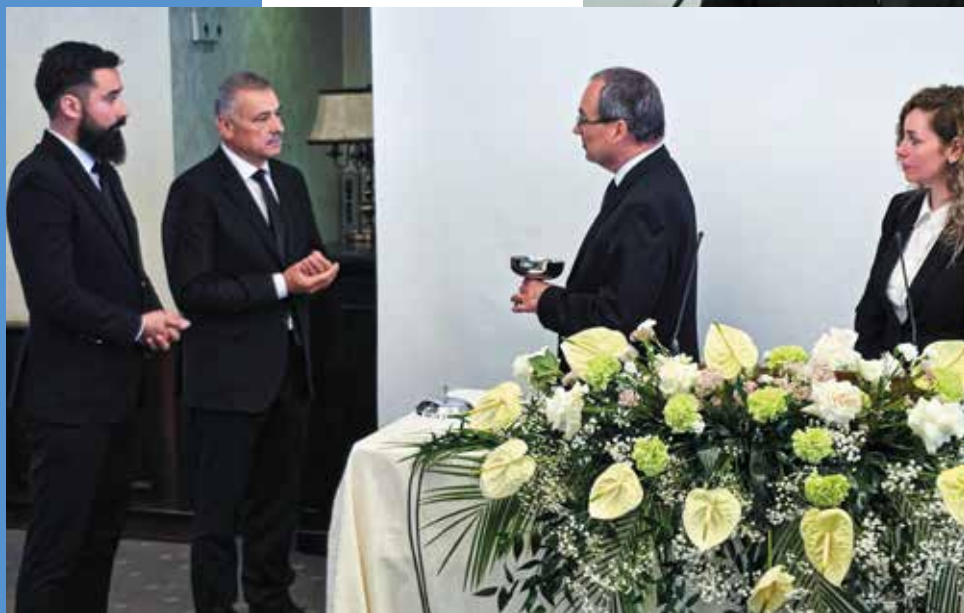
« Первоапостол дарует Святое причастие для усопших

выбрал эту ситуацию, но Я допустил ее. Не переживай, Я позабочусь о тебе и в этой ситуации. В Своей любви Я даю тебе все, что тебе необходимо, чтобы обрести завершение». Мы должны верить в это – в том числе, и я как Первоапостол. У меня есть свои представления о том, чего нам еще может не хватать для того, чтобы обрести завершение. Но Бог говорит мне: «Довольно для тебя благодати Моей!» Благодаря вере в это в результате возникают утешение и мужество.