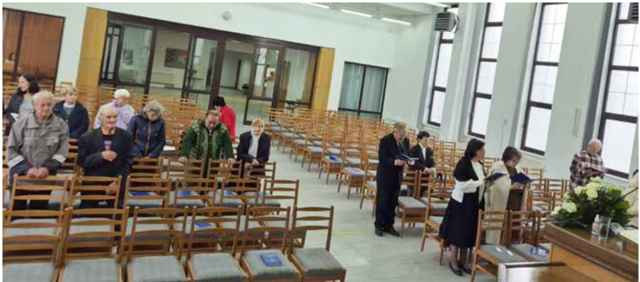
Тернополь. Во время воскресного богослужения Апостола