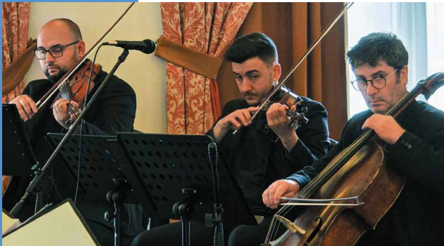
≈ Пению хора аккомпанирует струнное трио