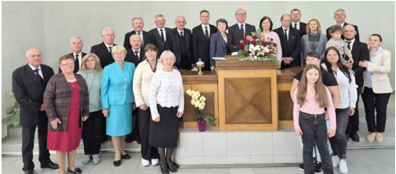
Тернополь. Общее фото с Апостолом