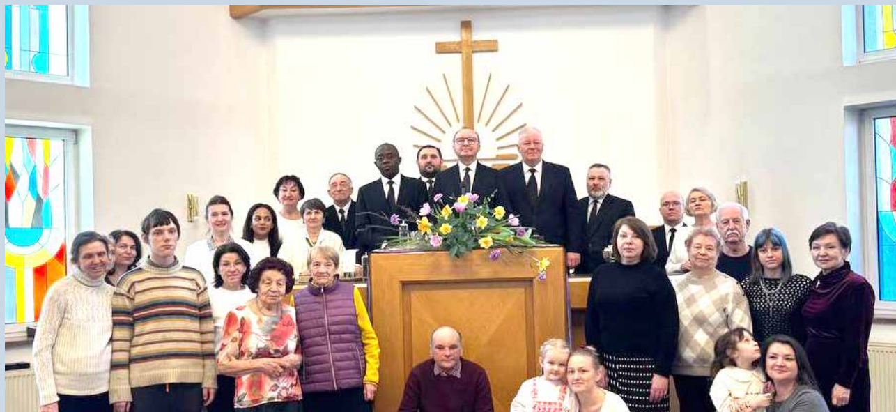
Киев. Совместное фото с Апостолом