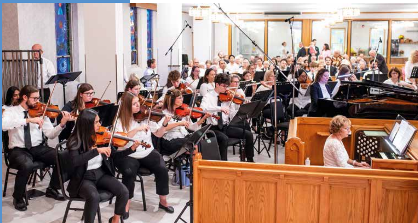
⌘ На богослужении в церкви на Маргарет-авеню (г. Китченер) присутствовали около 1100 прихожан