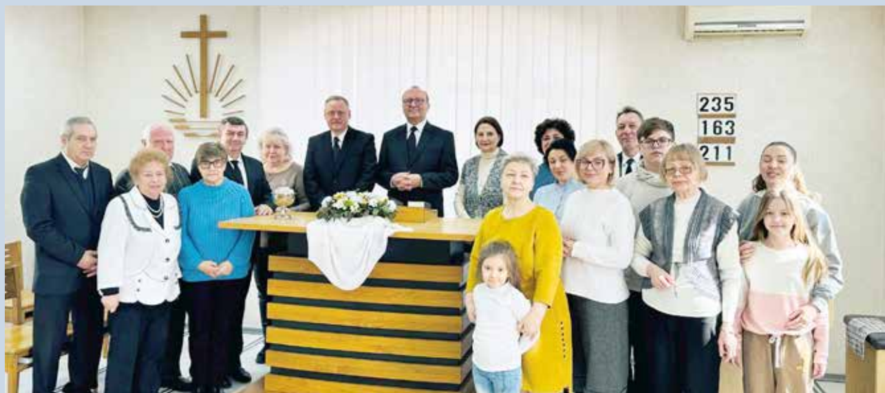
Одесса. Совместное фото с Апостолом