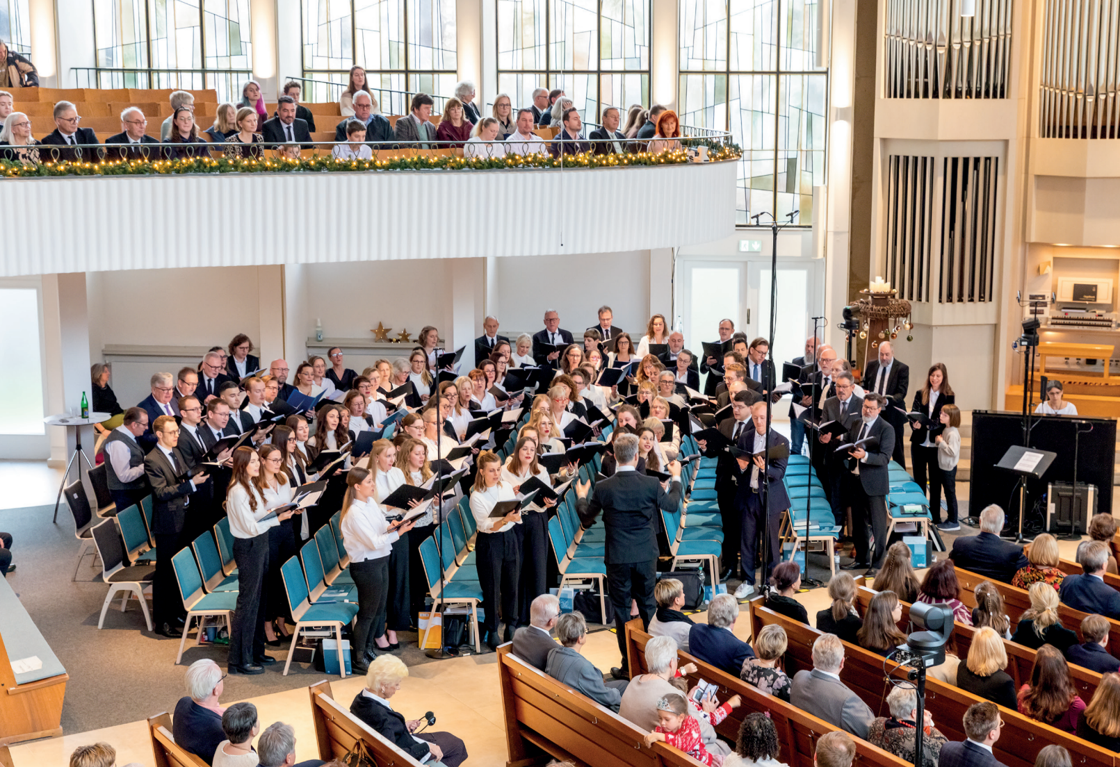
⌘ Хор в сопровождении фортепиано исполняет песнь покаяния «О, приди, чтобы освободить нас»

«Сделай это по-другому. Так для тебя будет легче». Таково слово Божье: Он показывает мне, что я должен изменить, чтобы достичь Его Царства. Он говорит мне, как я могу обрести милость. И Он помогает мне лучше справляться с испытаниями.