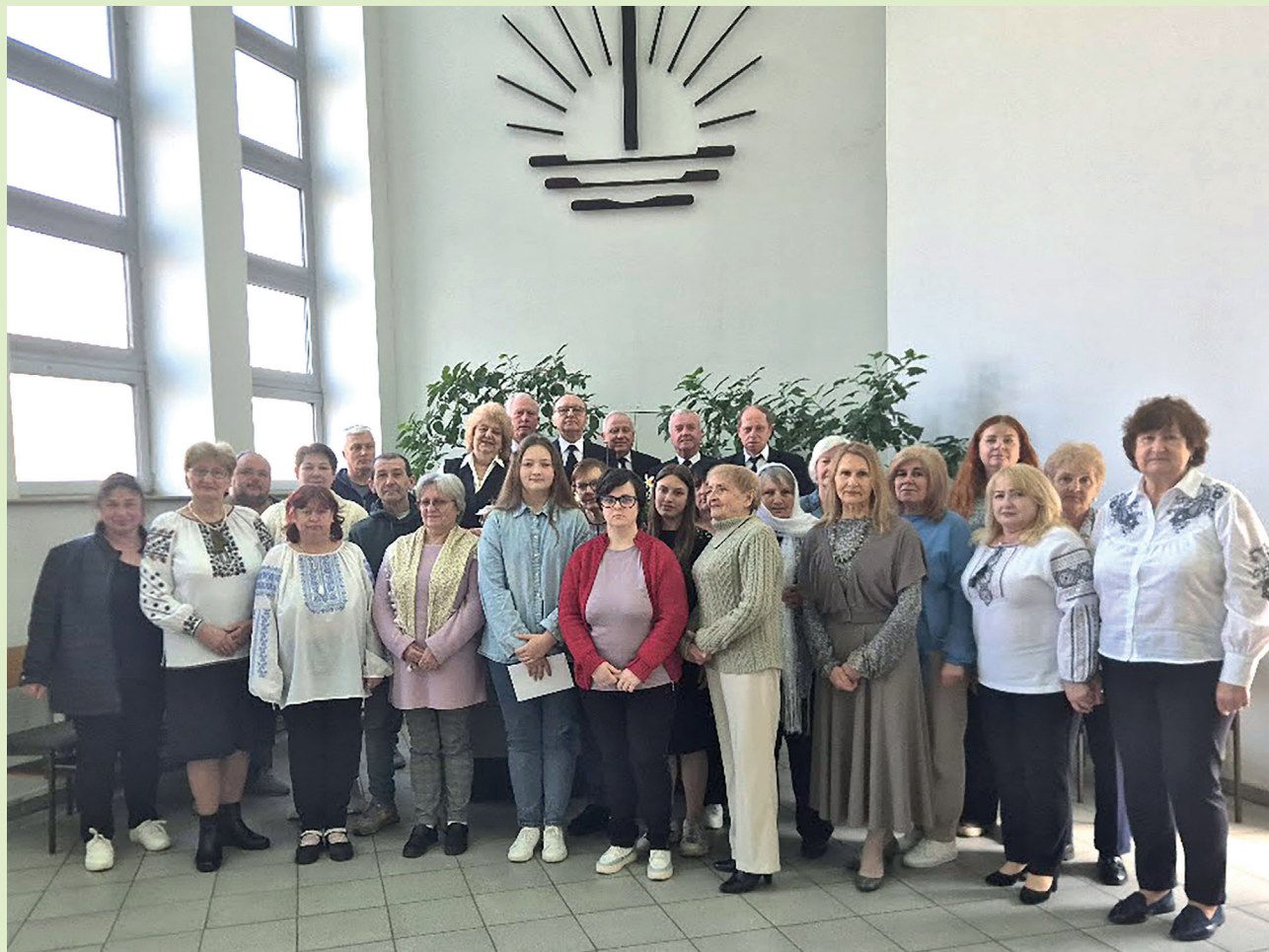
Ивано-Франковск. Фото с общиной на память