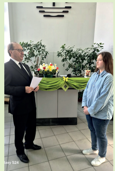
Ивано-Франковск. Во время Конфирмации