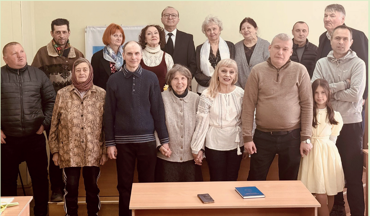
Турийск. Общее фото на память

После этого Апостол задал конфирмантам вопрос, желают ли они хранить Богу верность, на который они ответили словом «да», и вслух произнесли перед Богом и общиной обет (клятву) конфирманта: «Я отрекаюсь от дьявола и всех дел его и всего, что связано с ним, и вверяю себя Тебе, о Троица – Отец, Сын и Святой Дух, – с верою, послушанием и серьезным намерением быть верным Тебе до конца дней моих. Аминь!» После молитвы юные христиане посредством возложения рук Апостола приняли Господнее благословение. Оно укрепит их стремление выполнять данный ими обет, а также словом и делом исповедовать веру в Иисуса Христа.