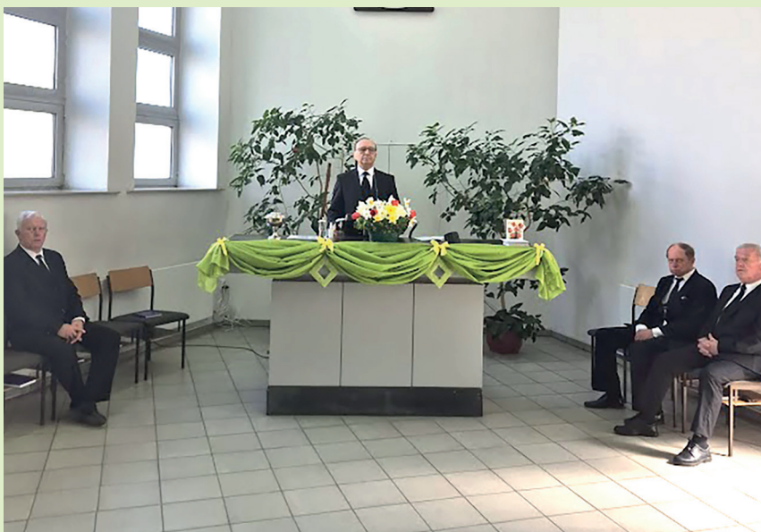
Ивано-Франковск. Апостол у алтаря