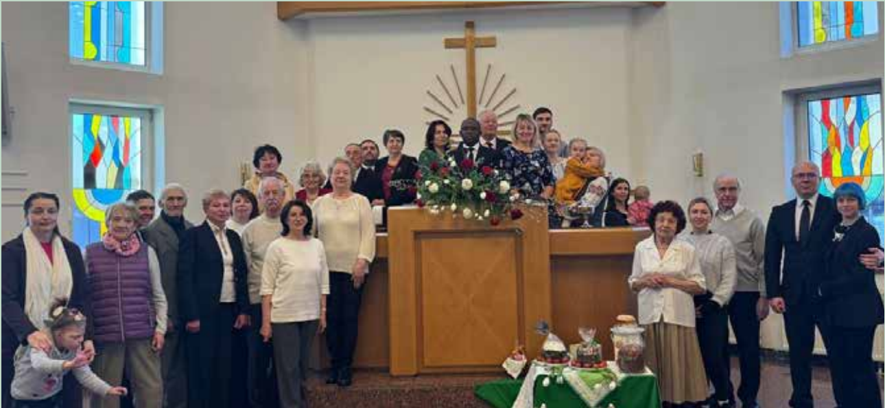
Киев. Групповое фото после трансляции богослужения Округного Апостола