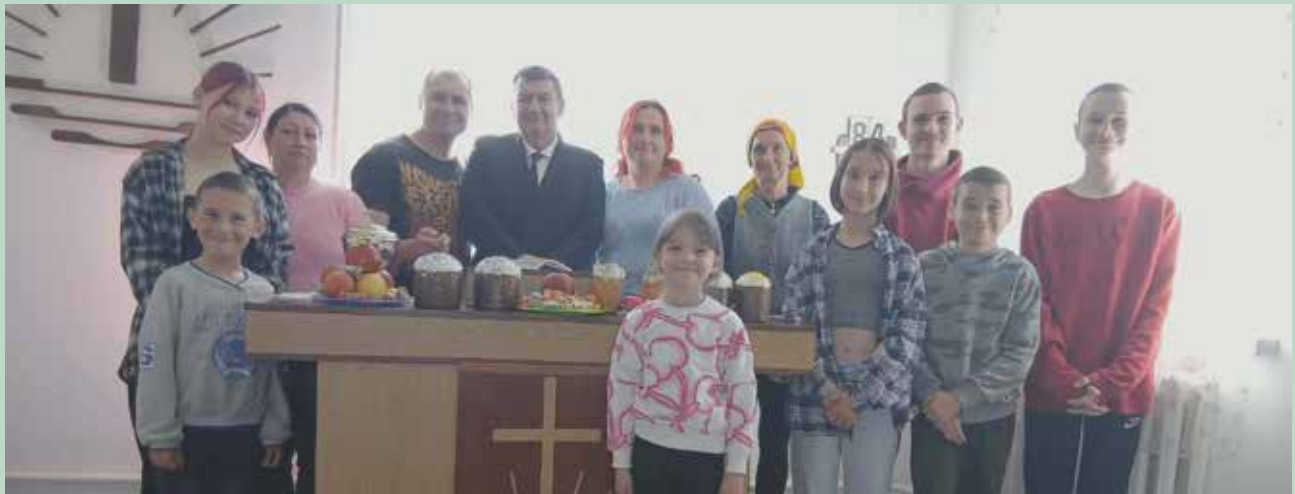
Новоалександровка. Совместное фото после трансляционного богослужения Окружного Апостола