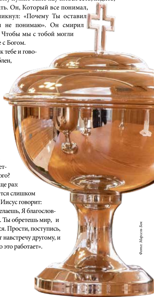
Фото: Марсель Бок

Я спрашиваю еще раз: неужели требуется слишком много? Господь Иисус говорит: «Если ты это сделаешь, Я благословлю твои усилия. Ты обретешь мир, и радость вернется. Прости, поступи, сделай один шаг навстречу другому, и ты увидишь, что это работает».