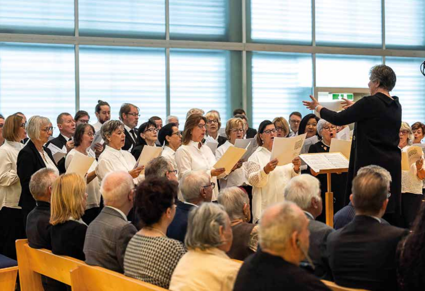
⌘ Хор поет: «Я знаю, Он мой лучший Друг»

Н аша задача – питать эту веру. Чем больше мы занимаемся этим, тем больше в нас живет Христос. В этом суть. Христос должен жить в нас, и мы несем за это ответственность. Не настоятель, не Апостол, не Первоапостол – мы сами. Наша задача – укреплять веру в Иисуса Христа. Там, где растет эта вера, Христос живет в нас. И эта вера проявляется в любви. Тот, кто верует в Иисуса Христа, не может иначе, как только любить Его и отвечать на Его любовь.