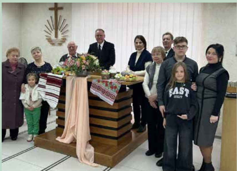
Одесса. Совместное фото после трансляционного богослужения Округного Апостола

Итак, важно « по всему миру » и « всему творению проповедовать Евангелие », то есть всем людям. Мы делаем это по поручению Того, Кому « ...дана ... всякая власть на небе и на земле » (От Матфея 28,18). Идти « по всему миру » означает также при любых обстоятельствах, в любом месте и в любое время свидетельствовать об Евангелии. Мы можем делать это даже тогда, когда переживаем невзгоды и нужду или ведем борьбу. Проповедовать Евангелие Воскресшего всем людям означает, что мы не устанавливаем никаких «критериев отбора» (он/она все равно неверующий, не христианин, не заинтересован и т. п.), а руководствуемся Божьим Духом. Именно тогда мы будем истинными свидетелями Воскресшего. Слова из Евангелия от Марка 16, 16: « Кто будет верить и креститься, спасен будет; а кто не будет верить, осужден будет » имеют весомое значение! Вера, крещение и наследование являются основой спасения, но Господь также вынесет приговор тем, кто не желает принять Его спасительные деяния».