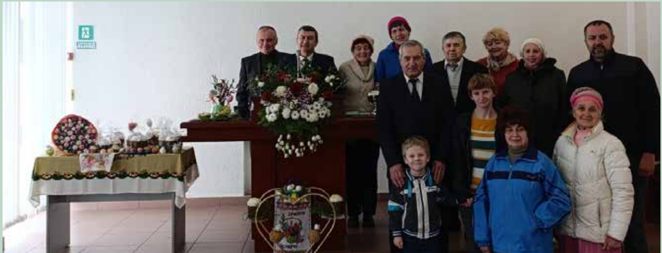
Николаев. Совместное фото после трансляционного богослужения Окружного Апостола